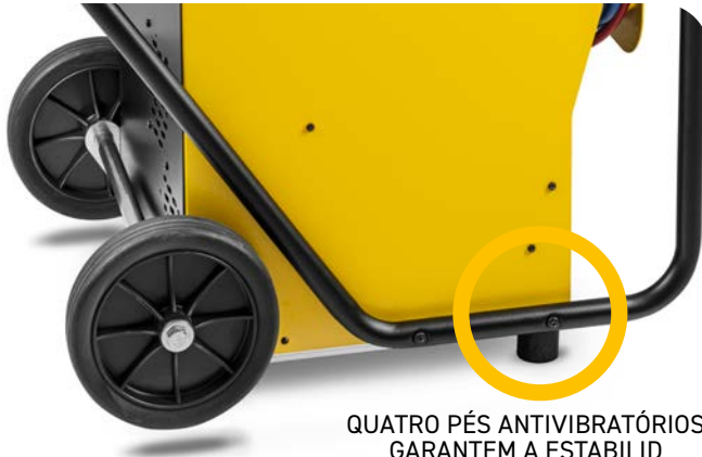
QUATRO PÉS ANTIVIBRATÓRIOS GARANTEM A ESTABILIDADE DURANTE A UTILIZAÇÃO